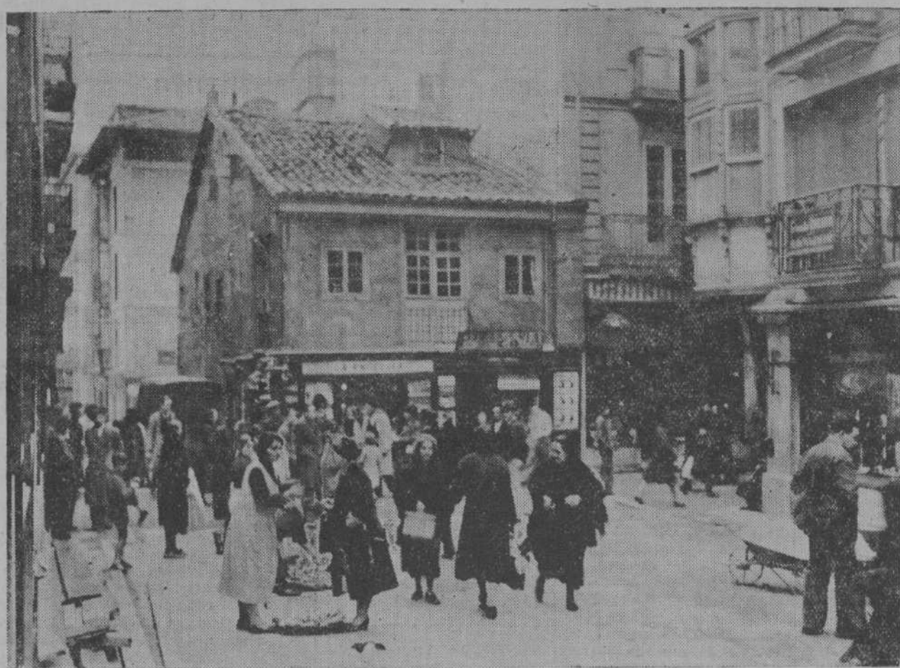
Esa desmedrada casita que ve el lector al fondo, primer término, del grabado constituye uno de los temas más interesantes de la actualidad local. Es la casa-tapón que hace esquina en las calles de San Francisco y Leizola y que, además de esquina, hace también un flaco servicio al prestigio urbanístico de la ciudad. LA VOZ DE CANTABRIA se complace vivamente de haber sido el iniciador de las gestiones que tan acertadamente se llevan por el alcalde para lograr la desaparición del lamentable edificio.

Y, al llegar aquí, pusimos punto a nuestra "entrevista" con el señor Pacheco.