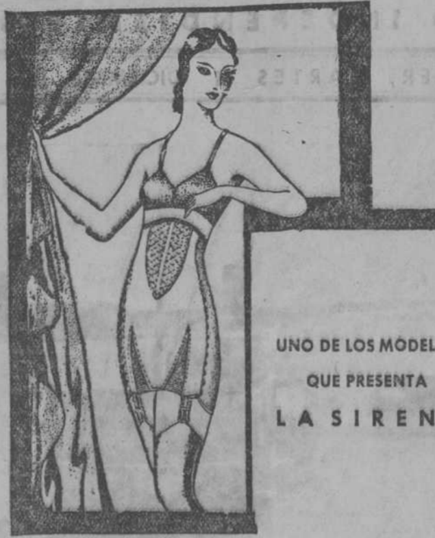
UNO DE LOS MODELOS QUE PRESENTA LA SIRENE

En la Plaza Vieja, número 8, en lo más céntrico y visible de la población, se ha abierto ayer, lunes, un nuevo comercio de corsetería, sostenes y fajas para señoras.