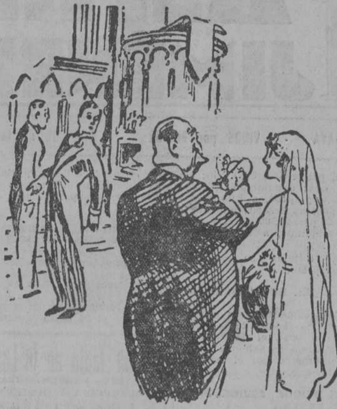
—Nos hemos equivocado de iglesia, papá; pero ese novio me gusta más.