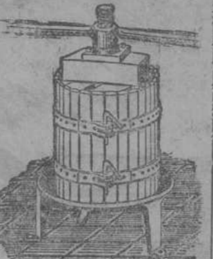
Prensas para lina y manzana desde 70 Fig. Estrujadoras para uva. Mecanizadas para industria.

ca tapicería, pesetas 33. Trepillos, juego 132 pesetas. TAPIERIA MARIN Blanca, 1. primero.