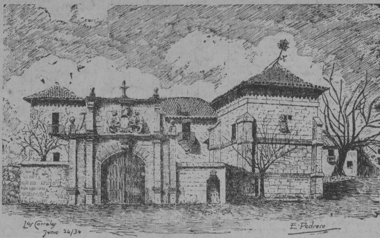
Casa del conde de Mansilla en Los Corrales de Buena. (Dibujo de Pedrero.)