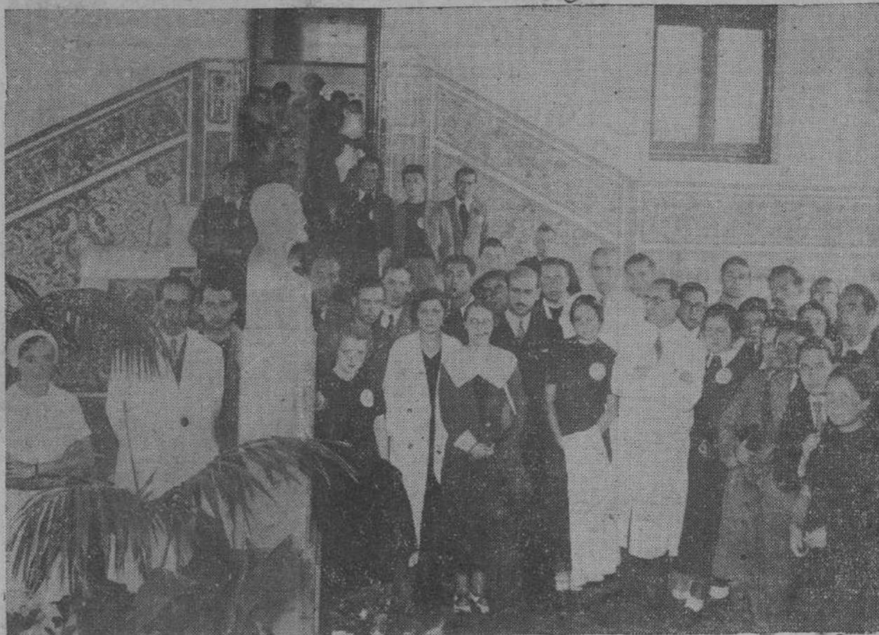
Los estudiantes de la C. E. U., en la Casa de Salud, ante el busto del marqués de Valdecilla, durante el homenaje que tributaron a la memoria del insigne benefactor.

LLAMA HERMANOS.—Burgos, 21.—Teléfono 15-85.—Servicio permanente.