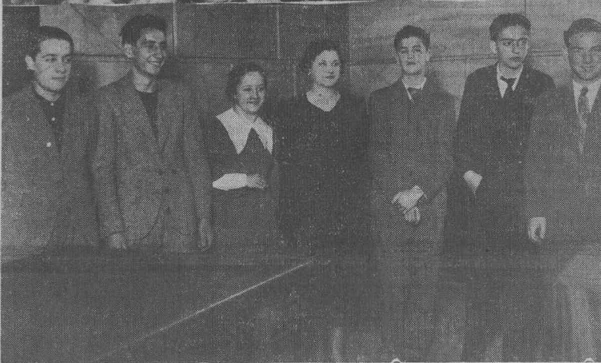
Un aspecto del salón de actos del Instituto de la calle de Santa Clara, durante el brillante acto celebrado ayer en conmemoración del advenimiento de la República.—Lindas señoritas e inteligentes muchachos, alumnos del Instituto, que dieron en dicho acto lectura a varias composiciones literarias.