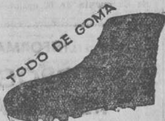
TODO DE GOMA