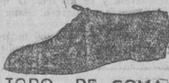
TODO DE GOMA