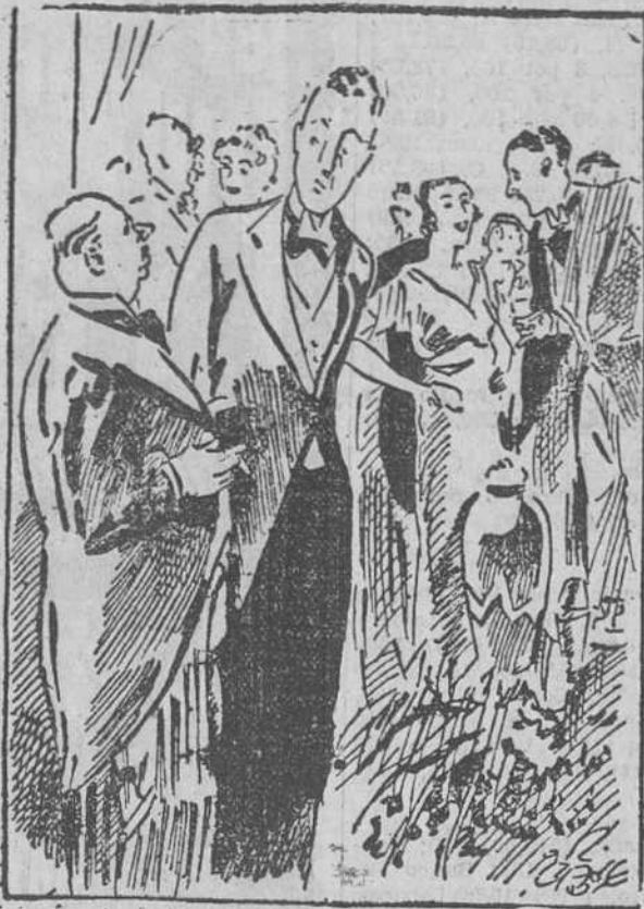
A RICA HEREDERA

—Yo orea que era usted el novio. —No; yo quedé eliminado en las semifinales.