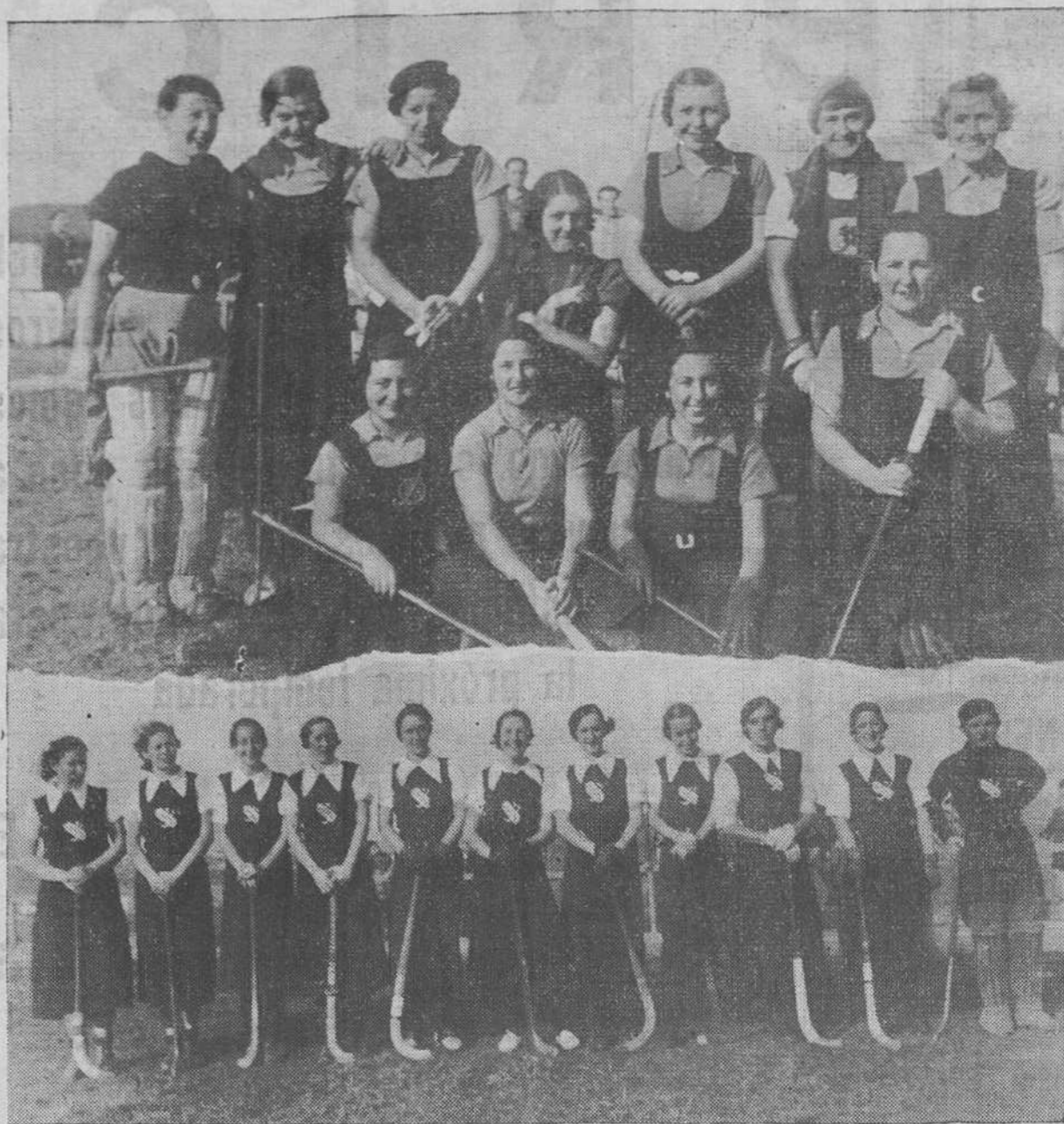
He aquí los dos notables conjuntos de los clubs Magdalena Hockey Club y Unión Montañesa, integrados ambos por bellas y distinguidas deportistas santanderinas. Estos dos equipos se vieron el pasado domingo frente a frente en los terrenos de Miramar, y tras interesante lucha, ésta terminó sin vencedoras ni vencidas, ya que el resultado fué de empate a cero, como reseñamos en nuestra crónica deportiva de ayer.

perjuicio al normal desarrollo de la función administrativa que les ha sido encomendada, rectificará de opinión en una nueva votación y aprobará los presupuestos. (Varios concejales de la minoría aludida y entre ellos el señor Palacio dicen que igual se puede hacer otro presupuesto más real.) Y sigue la discusión del orden del día.