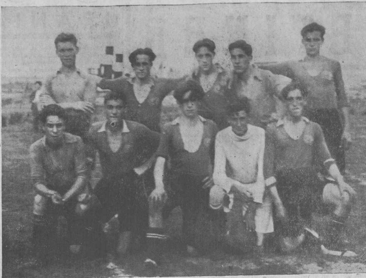
SAN ROQUE F. C. —Animosos muchachos del típico barrio del Prado de San Roque que han constituido un equipo "junior" con el título San Roque F. C., que viene actuando con brillantísimos resultados en el interesantísimo torneo oficial de la llamada Liga "Junior", organizada por la F. R. C..