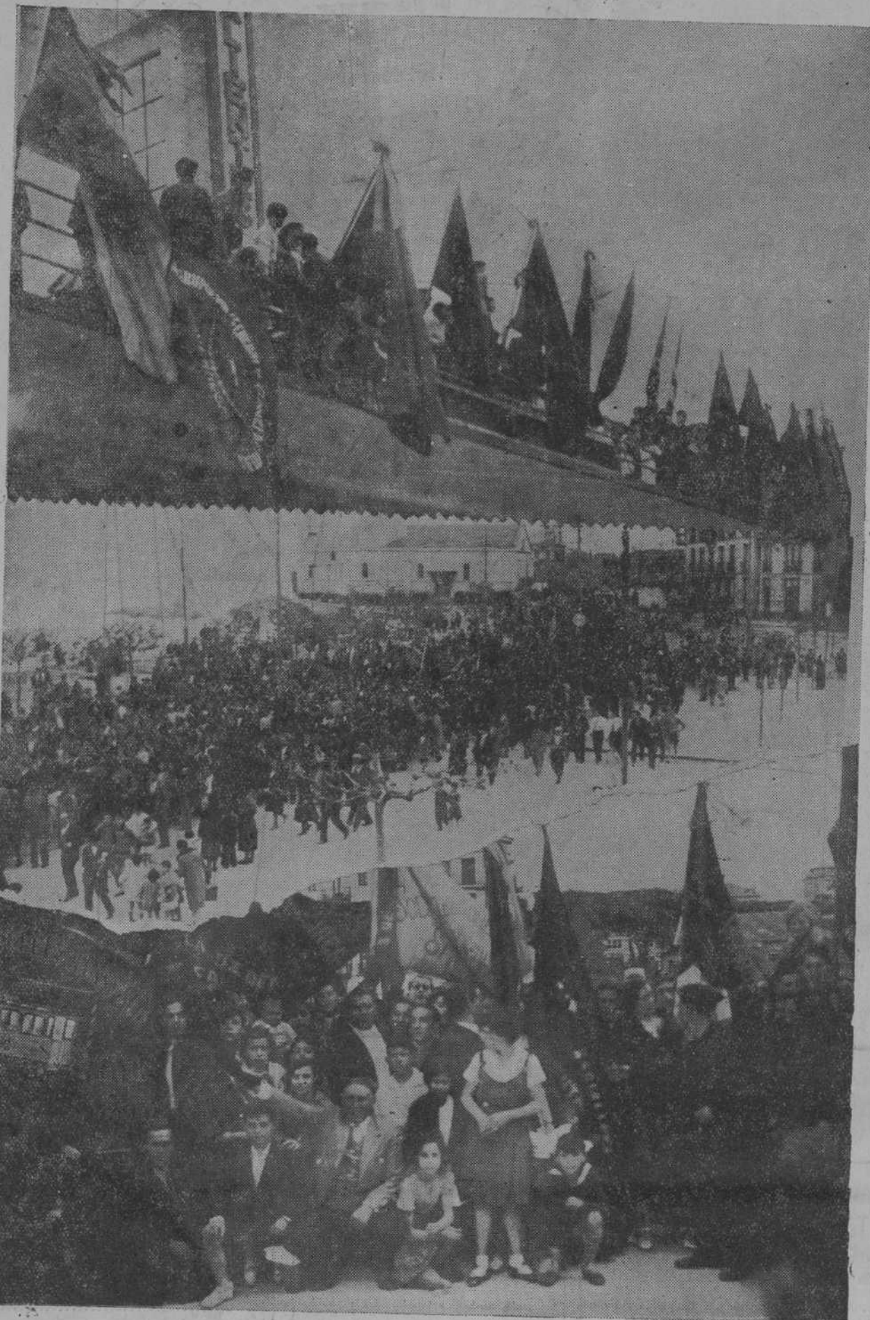
He aquí tres momentos de la jira al Sardinero, a la que asistieron las organizaciones obreras locales con motivo de la fiesta del Primero de Mayo.