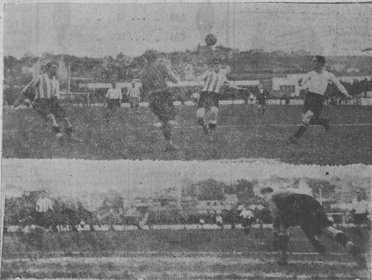
Un momento de acoso a la meta navesca.—He aquí como se marcó el tercer tanto de los nueve que el Racing consiguió apuntarse frente al Deportivo Alavés.—(Foto Alejandro)