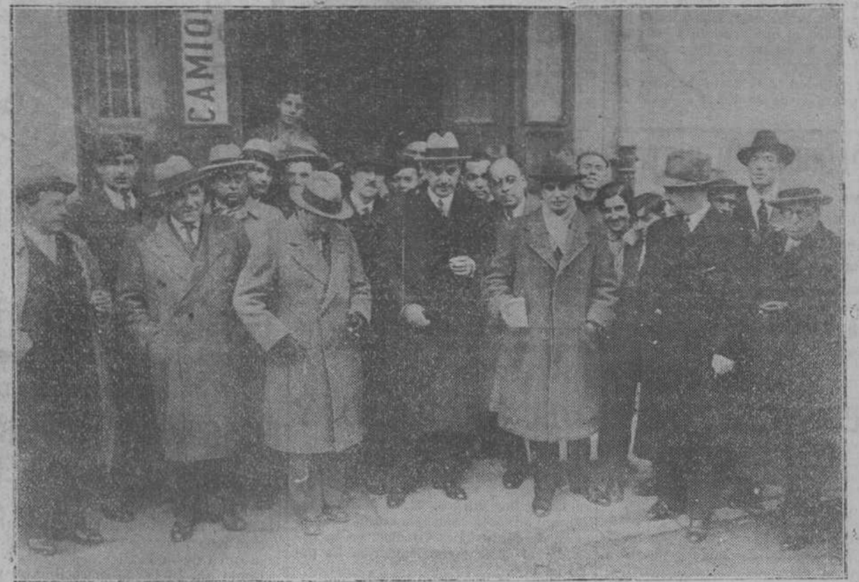
Don Miguel Maura, con algunos amigos políticos, al abandonar el Gran Cinema, una vez terminado el acto de propaganda organizado por el partido republicano conservador de Santander.