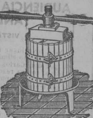
Prensas para uva y manzana desde 70 Ptas.