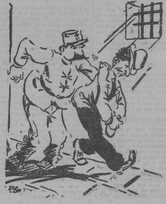
EL VENTRILOCUO.—Si, líeveme... Pero aun después que me corten la cabeza seguiré proclamando mi inocencia.