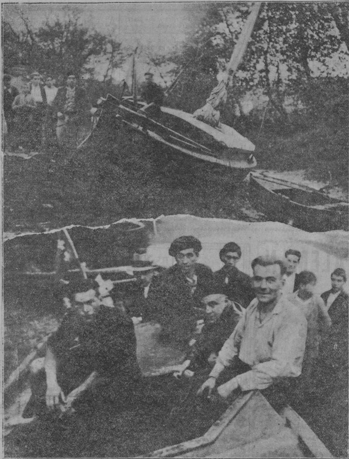
Los tripulantes del «Freiheit» varado en Unquera, relatan a nuestro compañero, mientras pesan para LA VOZ DE CANTABRIA, las aventuras de su viaje desde Danzig.

Las aventuras de Alain Gerbault, el navegante solitario, y los protagonistas se alimentan casi exclusivamente de pescados y legumbres.