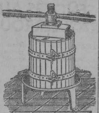
Prensas para uva y manzana desde 70 Ptas. Estrujadoras para uva Mechadoras para manzana

SE ALQUILA CHALET, Concordia, 28, tienda, informan.