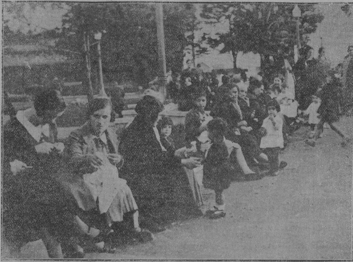
Tardes de sol en los bellos jardines de Pereda. Las mujeres hacen labor, ensartando también con las agujas los hilos astuciosos del comentario "de sus cosas": "Fulanita tiene otro novio"; "Mientras, los chiquitines corretean, como persiguiendo a su sombra fugitiva, por las alegres avenidas del parque. Ansias en todos de captar el aire y el sol que mañana acaso huirá hacia un portal para guarcerse de la lluvia.