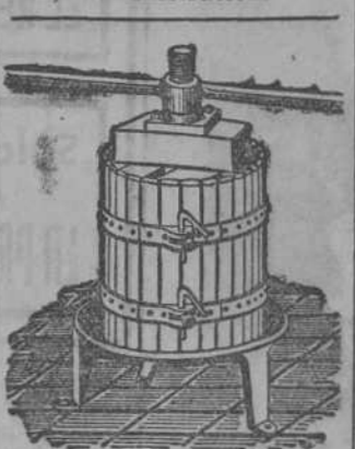
Prensas para uva y manzana desde 70 Ptas. Estrujadoras para uva. Machacadoras para manzana.

SE ALQUILA piso de chalet, soleado, baño, termo, y parte de jardín. Informes, Administración.