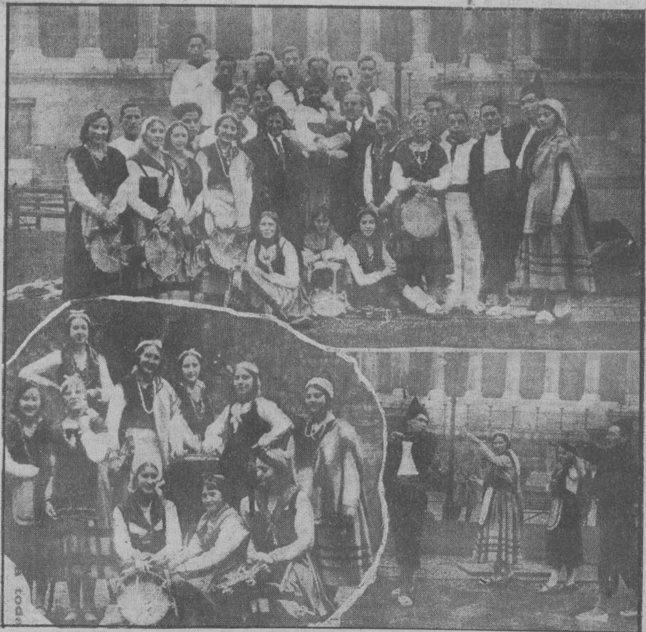
"VOCES CANTABRAS" EN LONDRES.—El periódico "Ahora" publica esta interesante información gráfica del paso de "Voces Cantabras" por Londres, en cuyo "Albert Hall" hizo la notable actuación folklórica una exhibición que mereció los más encendidos elogios del público inglés. LA VOZ DE CANTABRIA comenzará mañana la publicación de unos bellos reportajes de nuestra ilustre colaboradora doña Matilde de la Torre, relatando este viaje y actuación.