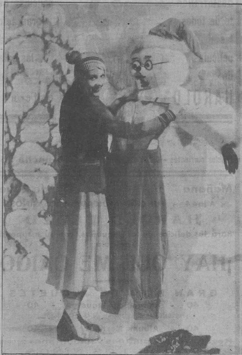
He aquí a la bellísima Anita Page, la encantadora «estrella» de la Metro-Goldwyn, demostrando prácticamente que no le preocupa gran cosa el frío. Es más, no sólo que no le preocupa, sino que su legítima expresión, la nieve, le merece un escasisimo respeto. Y vean ustedes a Anita en el quehacer de colocar unos pantalones a un muñeco. Apostamos lo que ustedes gusten a que si en vez de hallarse ante un muñeco se halla ante un hombre, quien se pone los pantalones es la bellísima actriz.