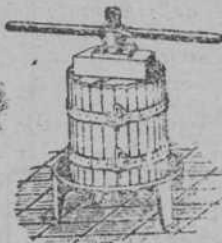
Prensas para uva y manzana desde 70 Ptas Estrujadoras para uva Machacadoras para manzana Foto catálogo: MATTHS GRUEFFEL BILBAO, Alen. 2. Mandos 29 81 33

MAQUINA «SINGER» , tres gavetas, bobina central; otra, bobina central industrial; otra, doméstica. Precios ocasión. Peña Herbosa, núm. 1.