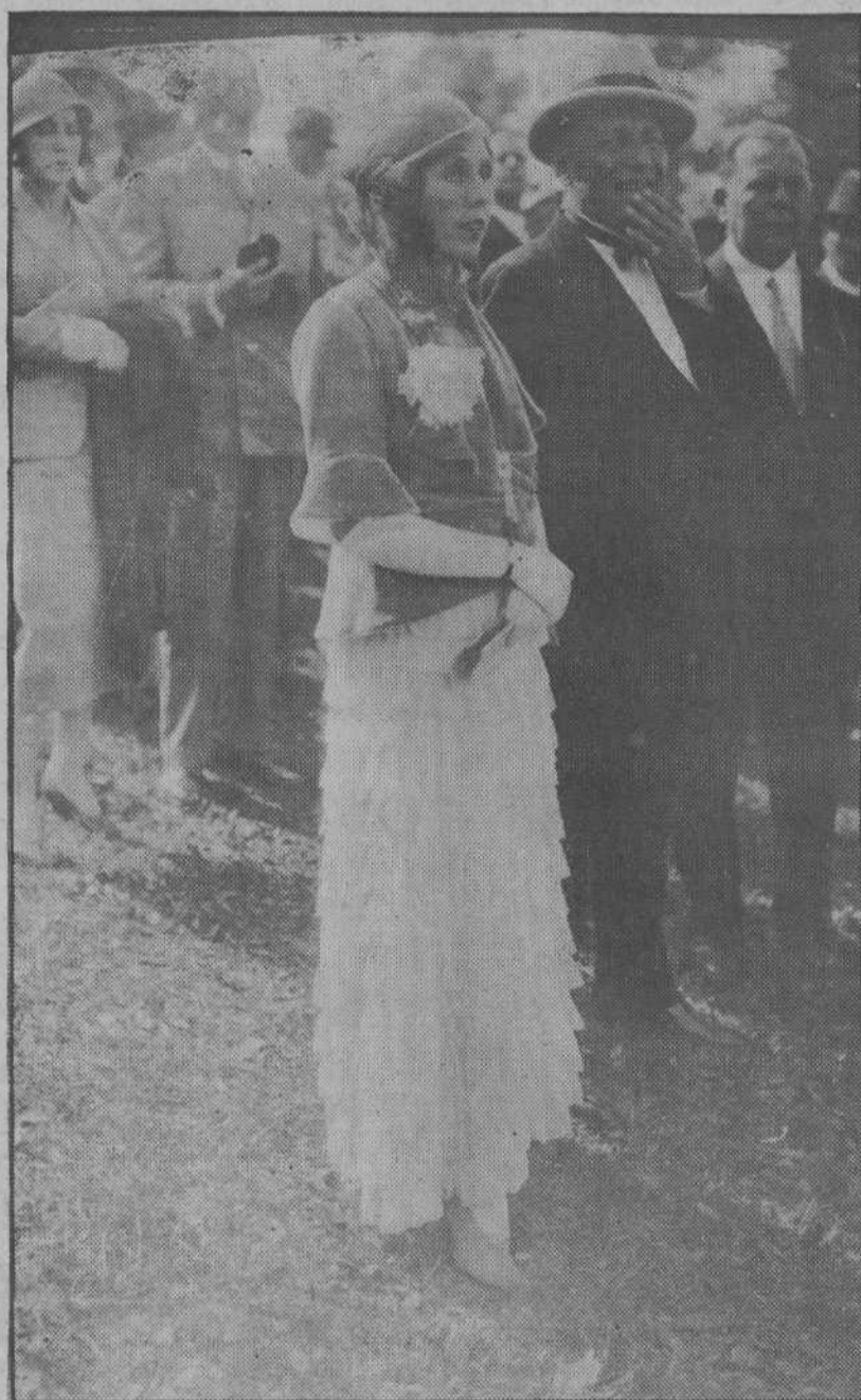
“He aquí un grupo parisino, cuya foto fué tomada en un soleado y plácido día...”