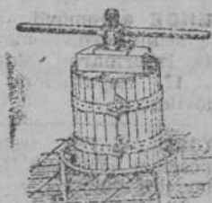
Prensas para uva y manzana desde 70 Ptas

Artículos para regalos.—PUERTA LA SIERRA (frente al Curildo).