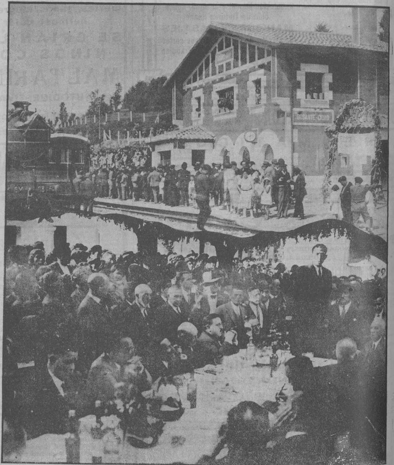
La estación de Ciudad, invadida por la muchedumbre de excursionistas y representantes de Burgos y de Santander. El tren especial hubo de efectuar varios viajes para trasladar a los visitantes a Santelices y Medina de Pomar.—Abajo: El alcalde de Medina de Pomar, pronunciando su breve y vibrante discurso desde la presidencia del banquete celebrado en la plaza de la histórica ciudad castellana.

Unas atinadas y justas observaciones, respecto a la ganadería en la Montaña que nos hizo don Antonio, prometemos ocuparnos debidamente de ellas.