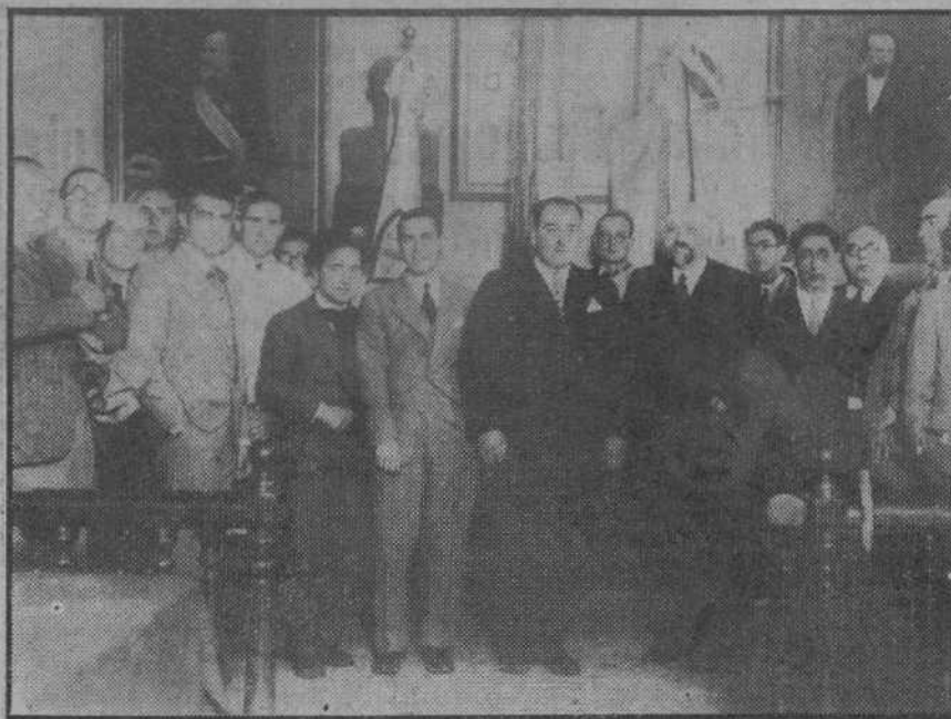
LA CORAL DE SANTANDER EN CASTRO.—El alcalde de la hermosa ciudad castreña y las representaciones de la Coral de Santander, Coral de Castro y Schola Cantorum, con el concejal santanderino señor Pérez, que ostentaba la representación del alcalde de Santander, durante la recepción oficial en el Ayuntamiento de aquella villa.

Advertimos a los señores que nos favorecen con el envío de originales que no hemos solicitado, que nos es imposible mantener correspondencia acerca de ellos.