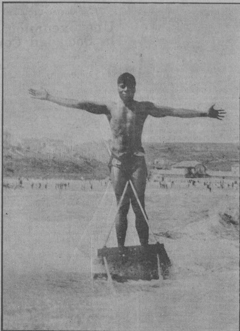
No se trata de hacer el chiste del "negro que tenía dos cintas blancas". Se trata de recoger la nota deportiva de las proezas que ha hecho este hombre en la bahía sobre una tabla...

Checoslovaquia.—Jornadas, 95 millones; dinero, 2.850 millones.