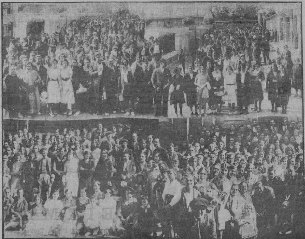
EN LLANES.—Varias notas gráficas de la importante excursión verificada por el Ateneo Popular de Santander a la próspera y simpática villa.—(Fotos García Alvarez)

La reunión hubo de verificarse con la asistencia de los siguientes señores: don