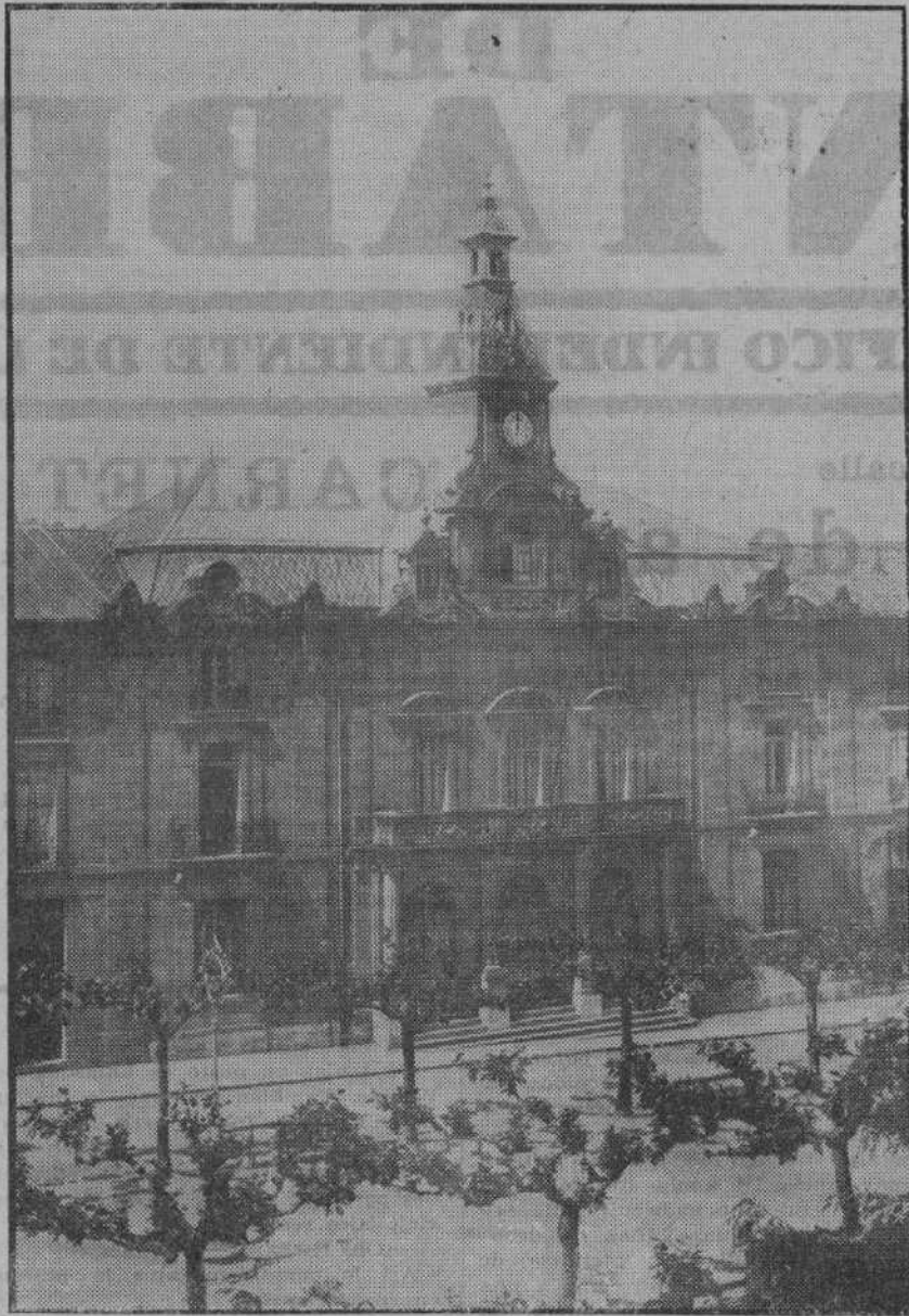
TORRELAVEGA.—El Palacio Herretero, hoy Casa Consistorial, habla del gusto y esplendor de otros tiempos de la bella ciudad.

Sección de Perfumería Compañía número 3 Perfumes, Collares, Pulseras, Máquinas fotográficas y otros artículos propios para regalo.