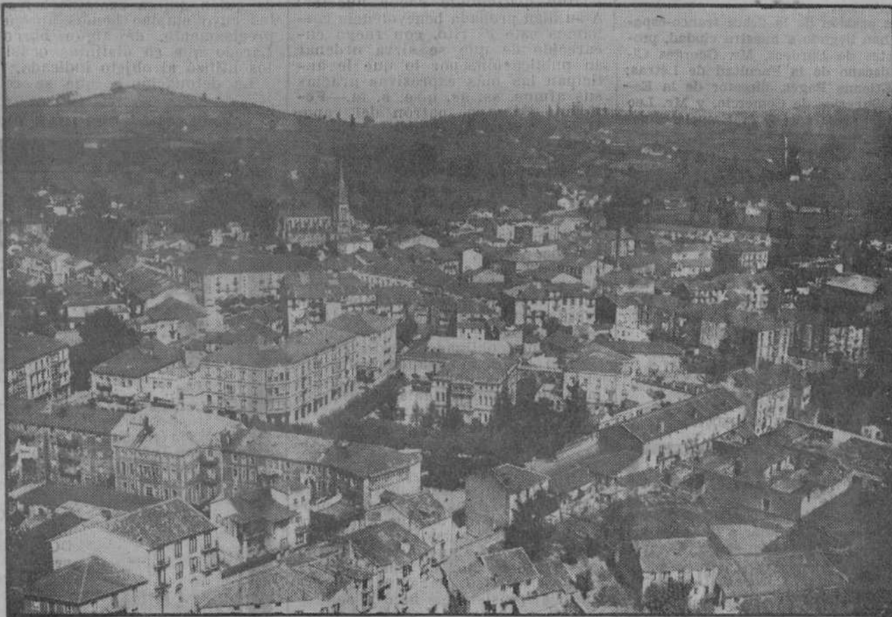
Desde la altura, Torrelavega muestra un encantador aspecto urbano.