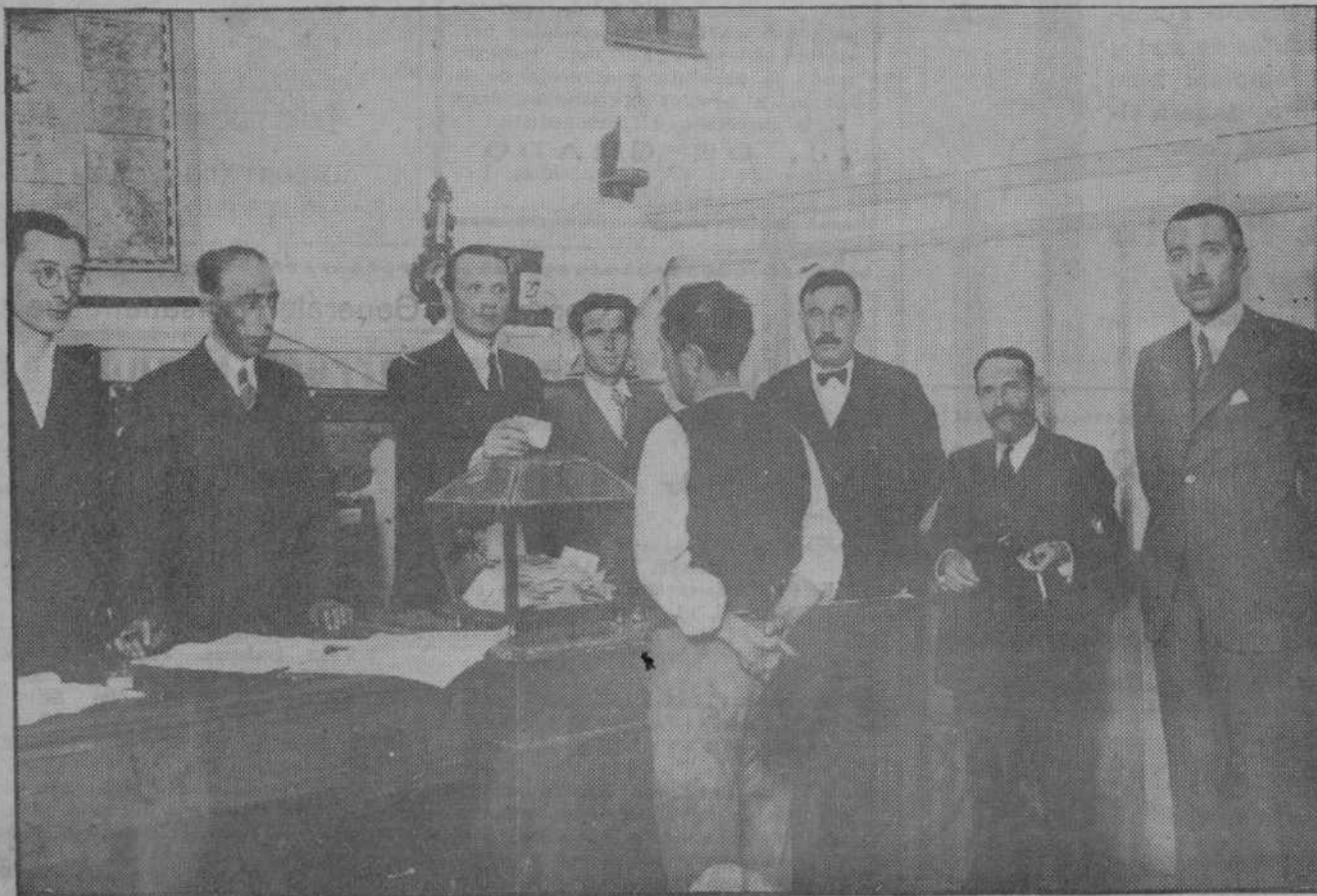
VISITA OFICIAL. —Ante el gobernador y el alcalde un proletario emite su voto en el colegio del Sardinero... El obrero acude a cumplir su función ciudadana en traje de faena...