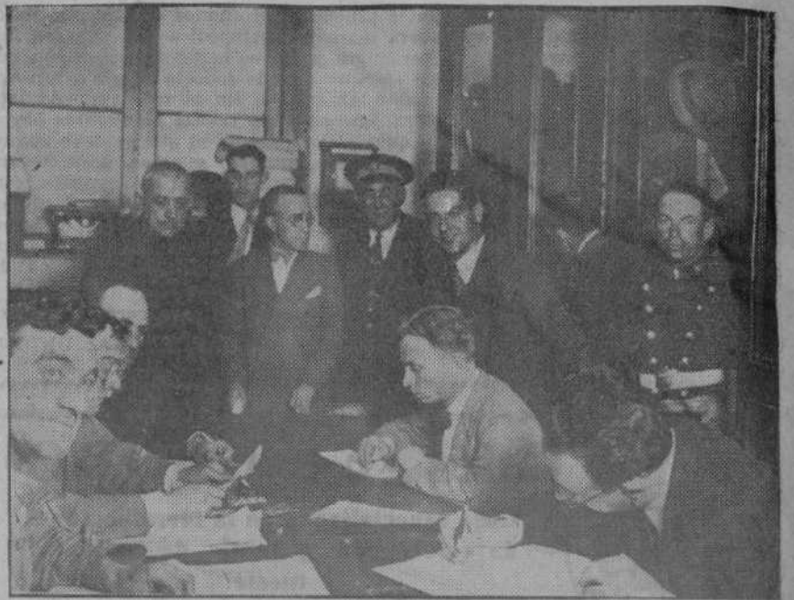
EL PULSO DE LA JORNADA. —En la Guardia municipal, periodistas y curiosos, van consignando los resultados definitivos de la elección, suministrados por las listas de los colegios de la capital... Humazo de tabaco, calor, ruido de conversaciones. El momento es poco agradable...