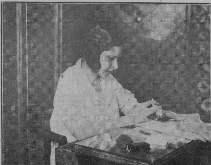
La linda obrerita está miniando una s manos delicadas...

Mary, laboriosa durante nueve horas, tiene ocios inteligentes de mujer moderna. Lee, estudia, se apasiona por el arte. Así, como ella, van creándose las nuevas generaciones de mujeres españolas.