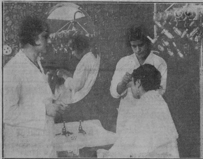
Las gentiles muchachas, en un momento intenso de su jornada laboriosa.