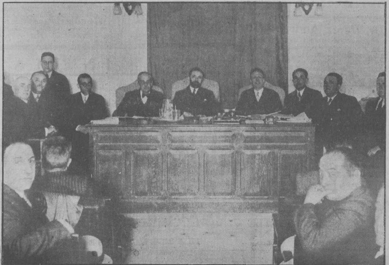
MADRID, EN LA NORMAL DE MAESTROS.—El ministro de Instrucción pública presidiendo la Asamblea de la