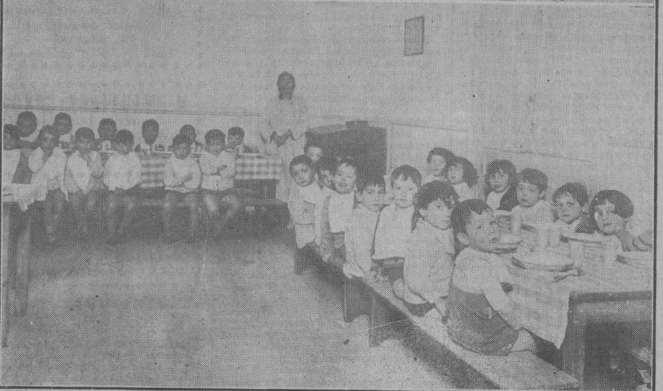
El gobernador civil con otras personalidades en el acto de reparto de ropas verificado ayer por la Junta de Protección a la Infancia.—Los niños que asisten a los comedores de la benéfica institución durante la comida servida ayer.