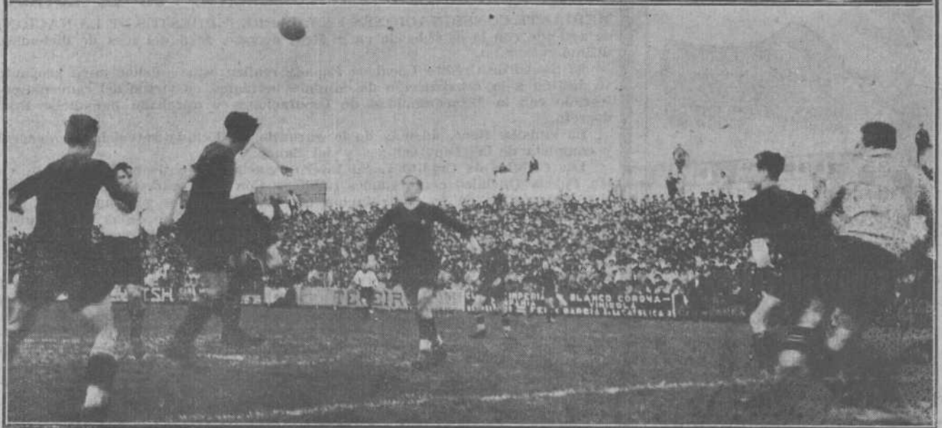
DEL PARTIDO RACING-BARCELONA EN EL SARDINERO.—Dos interesantes momentos del encuentro celebrado el domingo, durante los cuales la meta catalana se ve acosada. Véase la abundancia de camisetitas "negras" y la ausencia de las "blancas". Y en los dos momentos, Larrinaga en la brecha.