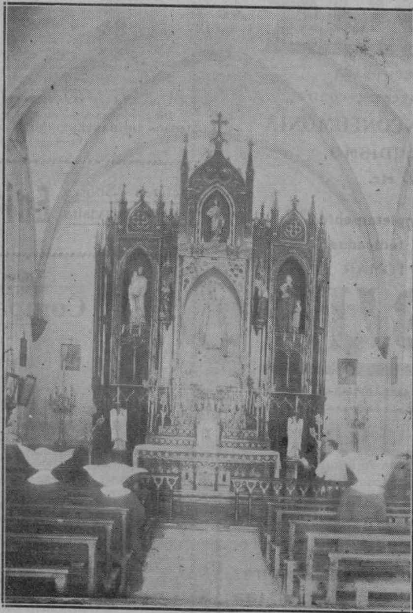
...De esta capilla tan bella y tan recogida de las monjas, llena de candelas...

Advertimos a los señores que nos favorecen con el envío de originales que no hemos solicitado, que nos es imposible mantener correspondencia acerca de ellos.