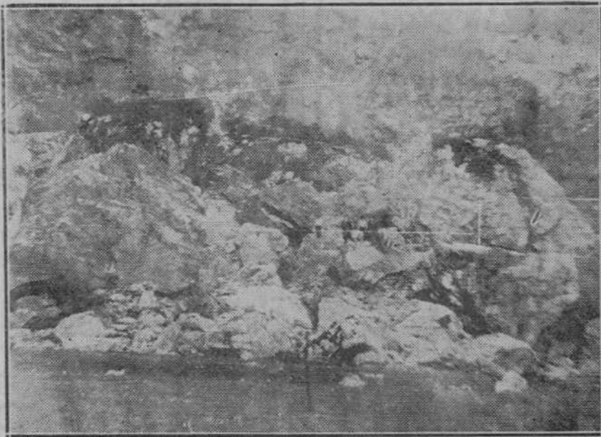
Grietas, cavernas, hendiduras formidables, bloques de mil metros cúbicos en esta cantera de Las Huertas...

cerca de veinte mil toneladas de piedra de inmejorable calidad para la construcción.