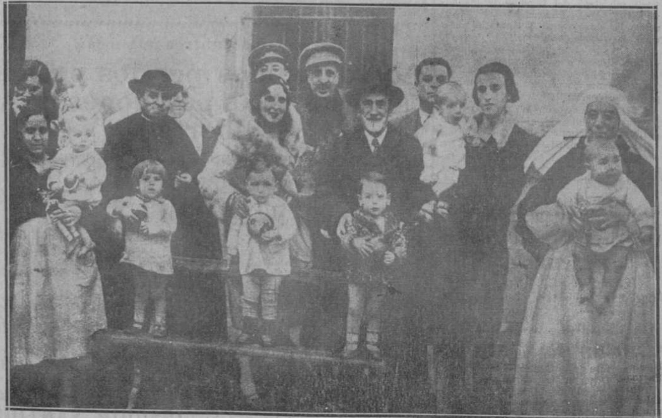
MADRID.—El insigne don Jacinto Benavente, en la cárcel de mujeres, después de haber repartido juguetes entre los niños de las reclusas.

LEA USTED EN NUESTRAS PLANAS DE INFORMACION TELEFONICA LAS ULTIMAS NOTICIAS DE ESPAÑA Y EL EXTRANJERO