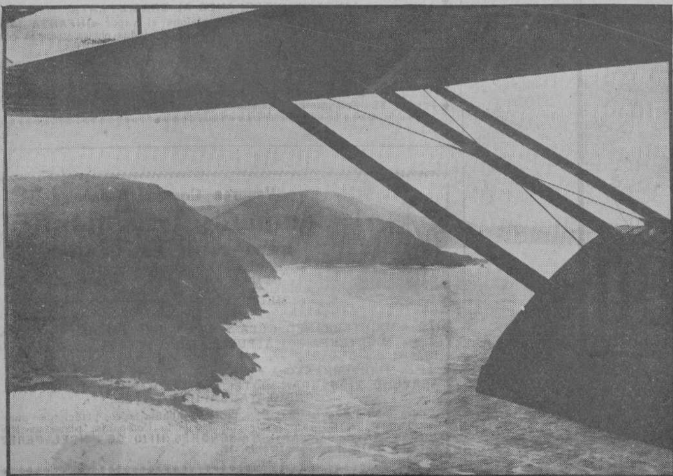
VOLANDO EN EL "Do. X"—Interesa de detalle de la costa de Santander.

TALLERES TIPOGRAFICOS DE LA «EDITORIAL MONTANESA», CALLE DE SAN JOSE, N.º 10