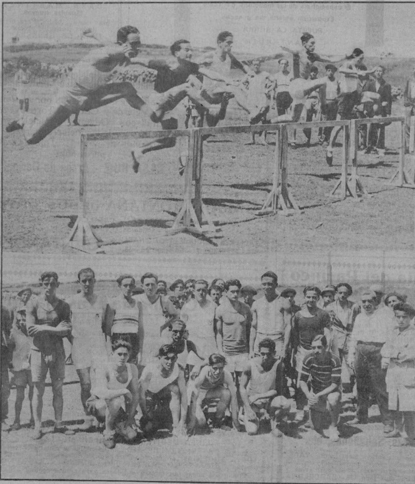
DE LOS CAMPEONATOS ATLETICOS.—Un momento durante la prueba de vallas.—Grupo de los atletas que tomaron parte en las competiciones.