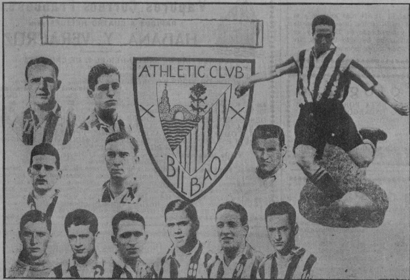
LA FINAL DE LA COPA DE ESPAÑA.—El pasado domingo conquistó el Athletic Club de Bilbao, en el Stadium de Montjuich, el título de campeón de España por undécima vez. He aquí los once nuevos campeones.