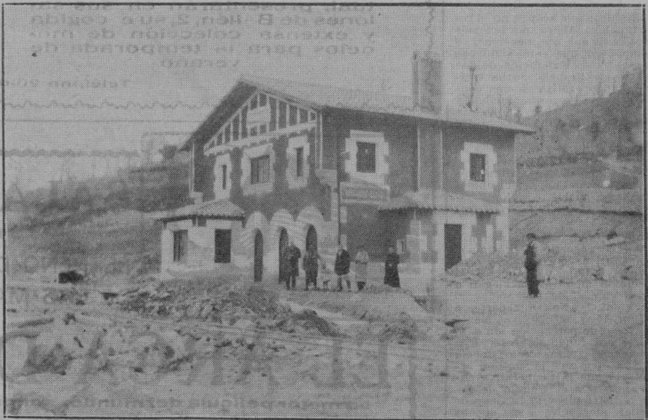
He aquí la estación de Ciudad, dispuesta, como ven los lectores, para recibir a los trenes de la línea Santander-Medirráneo. Decimos para recibir. ¿Podremos algún día afirmar que para darles paso por la divisoria hasta su término en Renedo?

Es una página que vale la pena de conocer: "A mediados del año 1864, el obrero español era poco menos que un "siervo". Construida su conciencia, sin derechos, sin Prensa, sin libros... Había de influir en el cinismo de algunos obreros de esta villa (Palafrugell) la lectura de una obra reciente es-