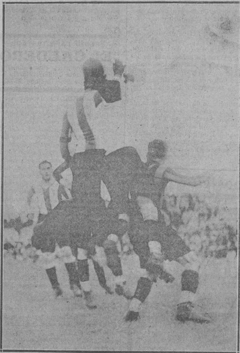
Un momento del partido Racing-Sestao Sport, jugado el domingo en el Sardinero.

¡Bella, dulce tierra de Francia, que tienes la sabiduría de saber elegir a tus hombres!