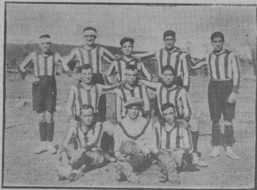
LOS NUEVOS CLUBS DE LA PROVINCIA El joven equipo «Polientes F. C.», del valle de Valderredible, que promete a aquella afición días de grandes triunfos en su categoría.