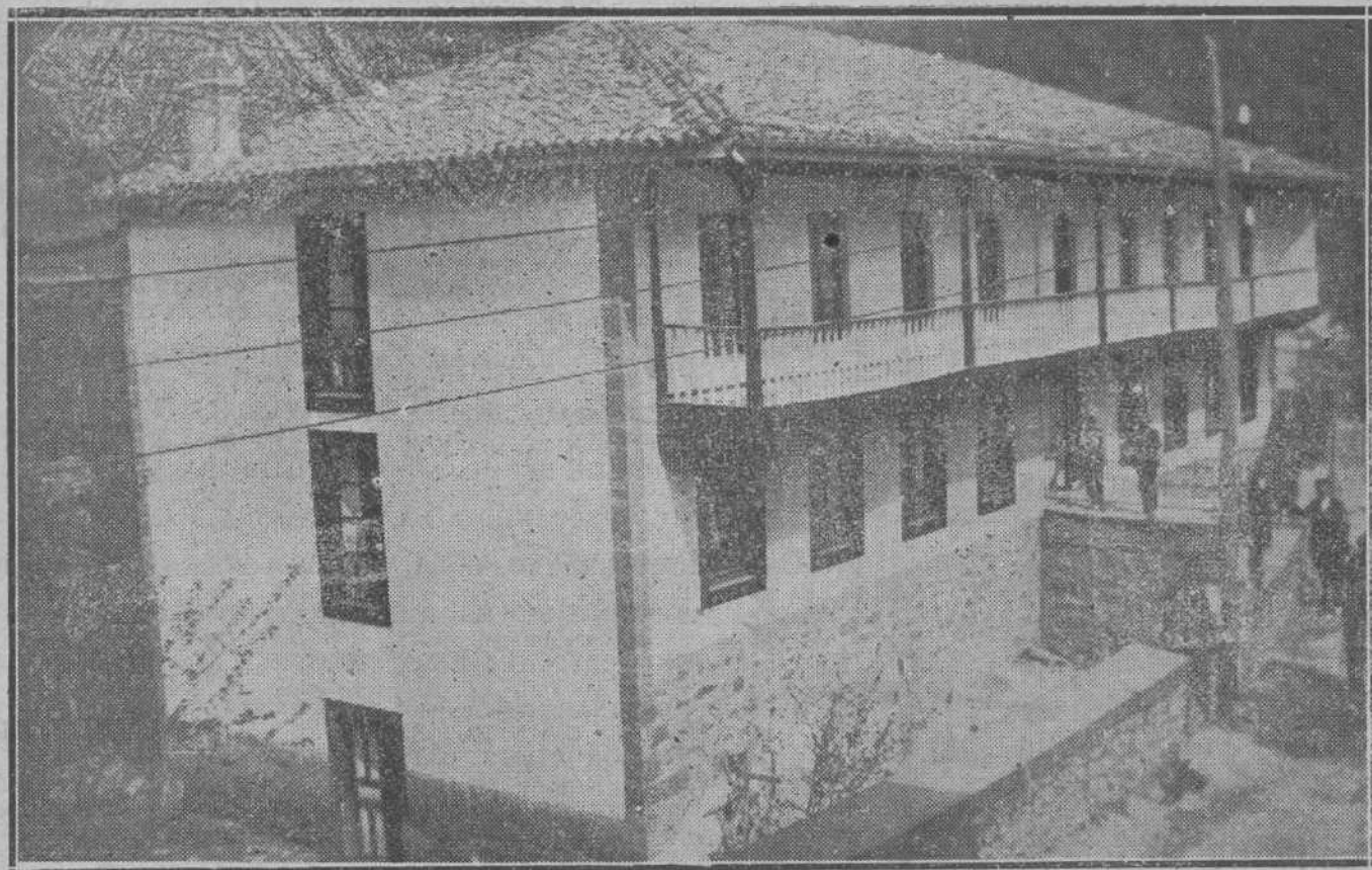
UNA GRAN OBRA DE CARIDAD.—El edificio del nuevo Asilo de ancianos desamparados de Liébana, establecido en Potes, que en breve será entregado a la Beneficencia provincial. Este Asilo es donación del llorado señor don Félix Cuevas, prestigioso lebaniego fallecido en Méjico.

LEA USTED EN NUESTRAS PLANAS DE INFORMACION TELEFONICA LAS ULTIMAS NOTICIAS DE ESPAÑA Y EL EXTRANJERO