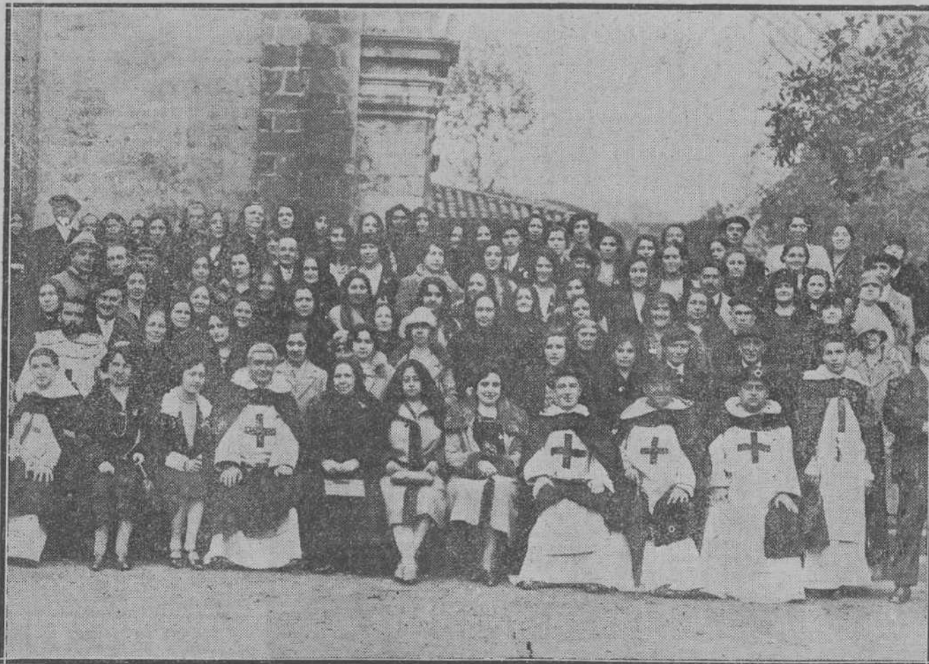
LIMPIAS.—Peregrinación de Algorta (Vizcaya), que el pasado domingo visitó el santuario de la Bien Aparecida, y en esta villa la iglesia donde se venera el Santo Cristo de la Agonía.

Y a medida que iba avanzando su vida iba perfeccionando sus medios de impresión. Las más perfectas máquinas