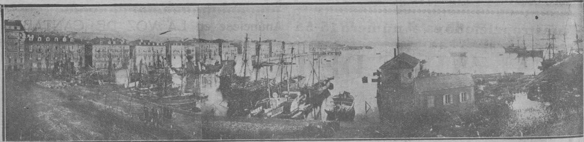
De los tiempos en que se hizo esta fotografía, a los que actualmente corren, han pasado más de cuarenta años. Vese en ella la rada que ocupan hoy los jardines de Pereda, y los viejos barcos con ruedas que hacían la navegación al Puntal y a Pedreña. Pinazas, pataches, veleros que hacían el recorrido de la costa Norte hasta Pasajes, están reunidos allí en una amalgama de velas de trapo y de cascos viejos. Todo ello se acabó con el último carro de escombros que cayó en el relleno. Ahora en la vieja dársena han florecido unos jardines en alguno de cuyos ángulos canta su canción de agua una fuente con pececillos colorados y azules. Los tiempos han cambiado mucho para beneficio del progreso de Santander.

Se ruega a los comerciantes procuren tener cerrados sus establecimientos, de diez y media a una, el lunes próximo, como testimonio de pésame por el fallecimiento de Su Majestad la Reina doña María Cristina (q. e. p. d.)