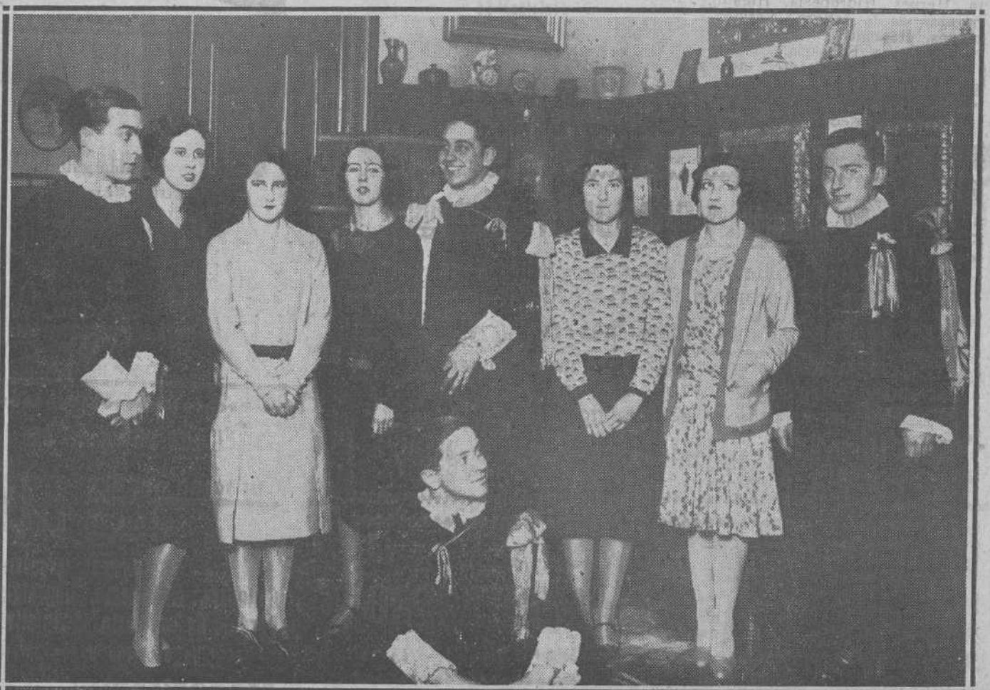
LA TUNA VALLISOLETANA.—Los simpáticos estudiantes visitan a su bella y aristocrática presidenta, la

En éste se dirige a Méjico numerosos arroceros valencianos. Lleven todos un viaje feliz.