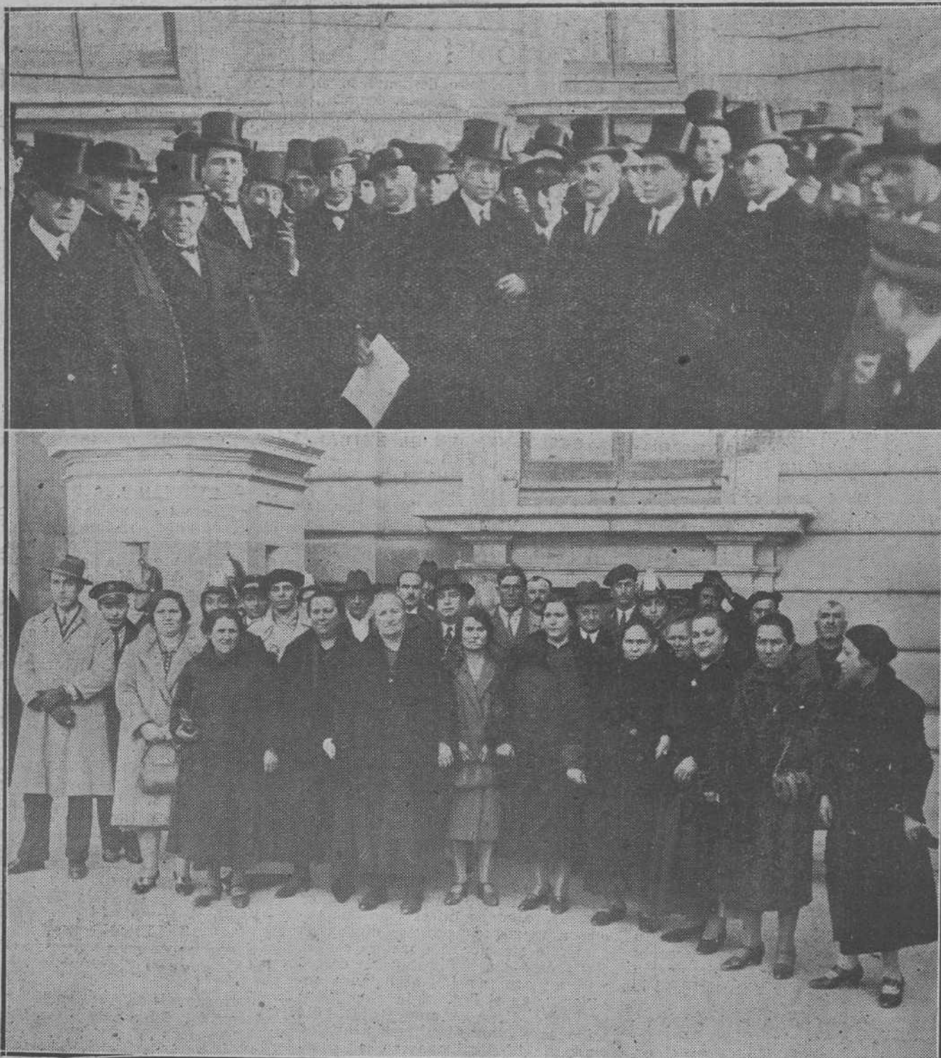
DEL ENTIERRO DE LA REINA DOÑA MARIA CRISTINA.—Las autoridades y representaciones santanderinas.—Las pescaderas de Santander que asistieron al fúnebre acto.

Vayan por donde vayan las corrientes literarias del Mundo, aquella huella abierta en nuestras almas será indeleble. Cuando paseamos por nuestro pueblo al azar del viento que sopla, y esto nos sucede con frecuencia, un tirón misterioso nos lleva hacia la calle Alta. Cuando, fuera de Santander, el nombre de Pereda suena en labios extraños, sentimos un enternecimiento que hace asomar a los ojos las lágrimas. Todo el espíritu de tierra, florece arrollador con el recuerdo del hombre que nos enseñaron a amar y a admirar desde niños. Así, cuando al cabo del tiempo un día aparecimos frente a la "Cajigona", que es como el compendio de todo el paisaje y de toda la obra perediana, experimentamos