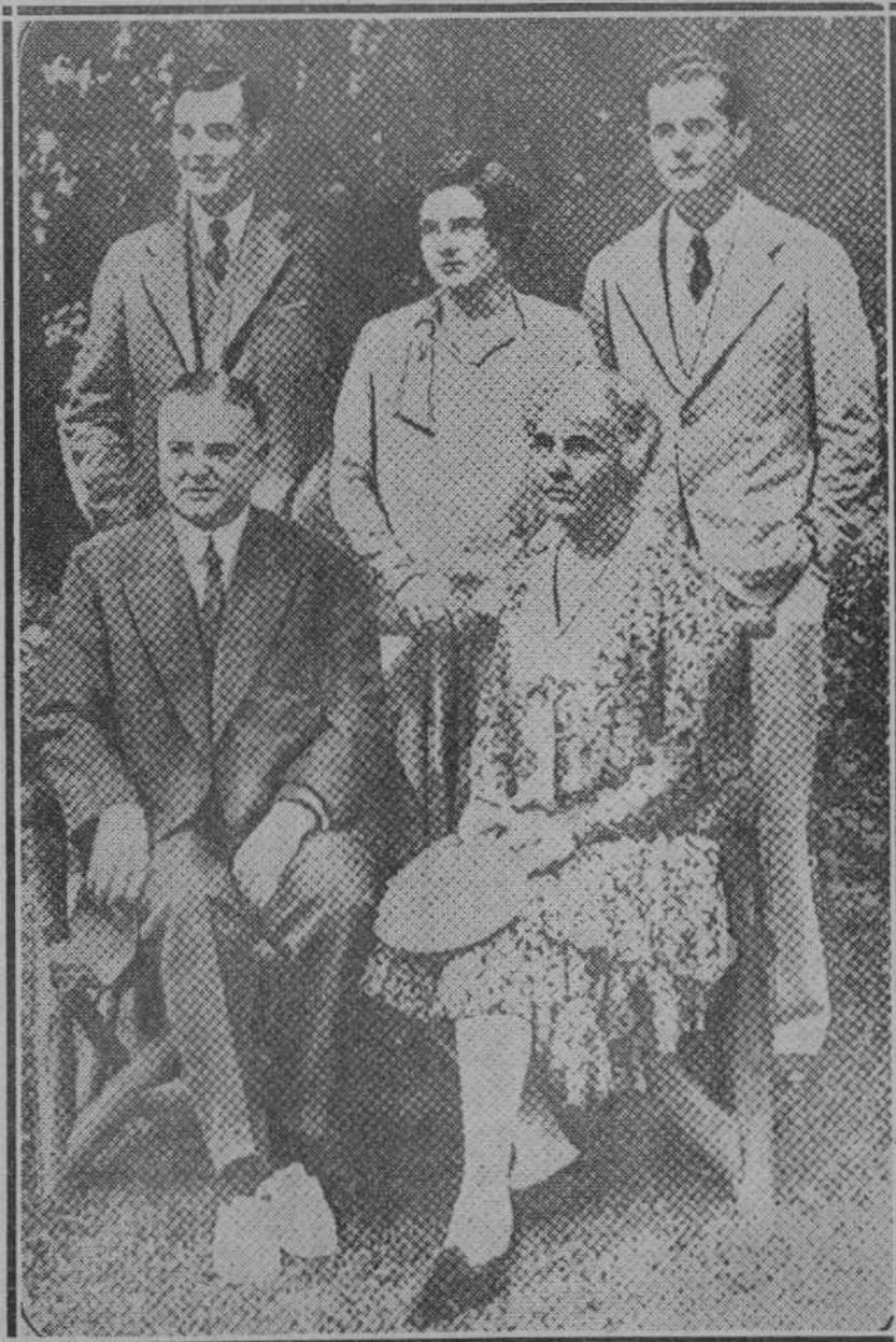
EL GRAN MAGISTRADO Y SU FAMILIA.—Mister Hoover, presidente electo de los Estados Unidos, con su esposa e hijos.

Y... si vas a Bilbao, no dejes de comprar bombones y caramelos de Asun. Arenal, 1. Frente a la Plaza Arriaga.