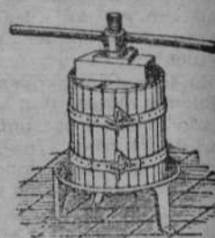
Prensas para uva y manzana desde 10' 2.

TRASPASO almacén de bicicletas muy acreditado, por cambio de negocio. Razón en esta Administración.