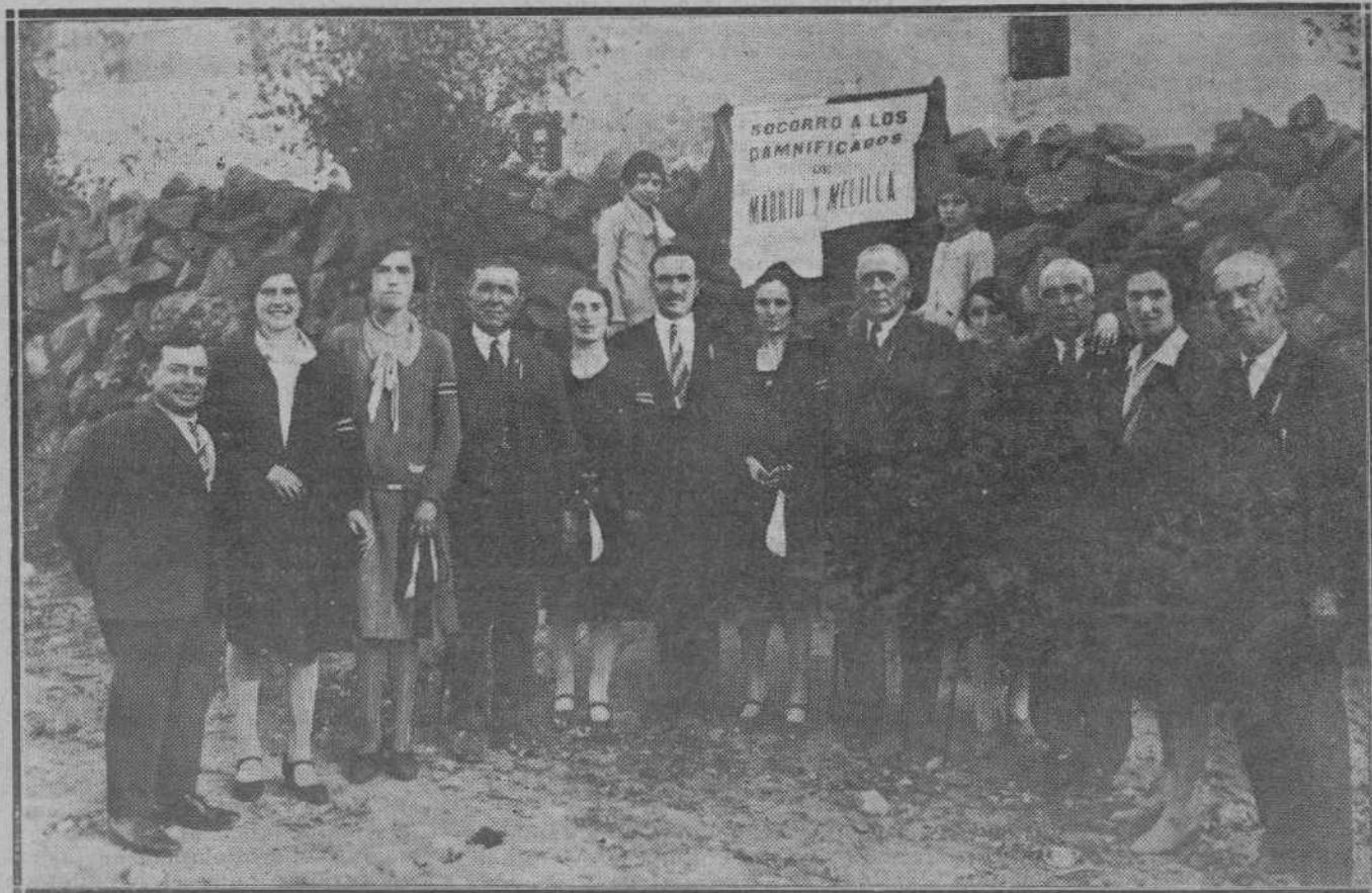
LA CARIDAD DEL PUEBLO DE CUETO.—Comisión organizadora y bellas jóvenes postulantes que recaudaron fondos para engrosar las suscripciones destinadas a socorrer a los damnificados de las catástrofes ocurridas en Novedades y Cabrerizas, recientemente. (Foto Alejandro).

Santander, con sus necesidades crecientes, no está debidamente