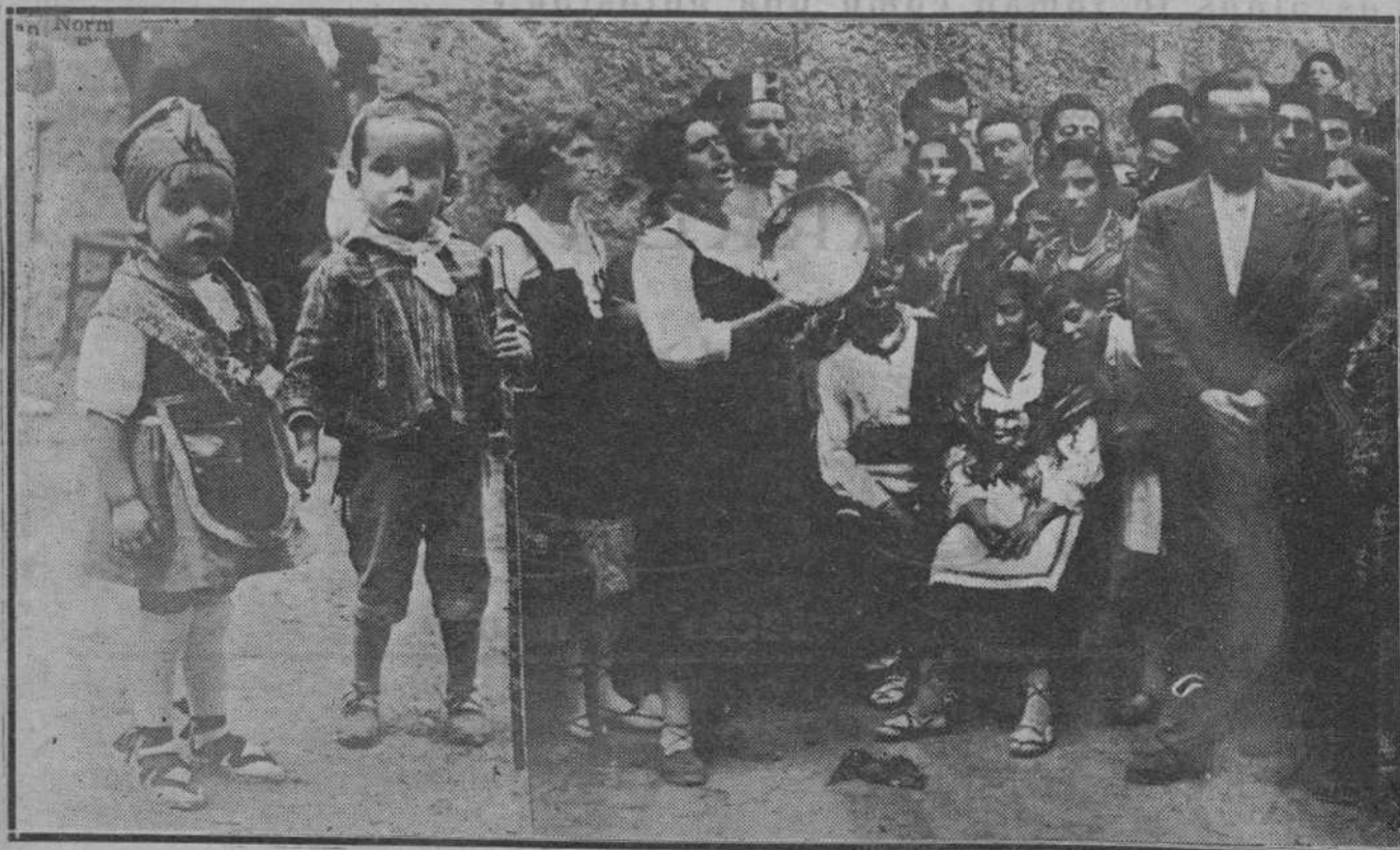
SAN MIGUEL EN PUENTE VIESGO.—Un detalle del concurso de bailes típicos, al son del canto y pandero, que se ha celebrado con tanto éxito en el pintoresco lugar balneario, con motivo de las fiestas de San Miguel.—A la izquierda, una pareja de niños vistiendo el típico traje de la Montaña.

El aventurero enfiló rumbo a Oeste. Que la suerte le proteja.