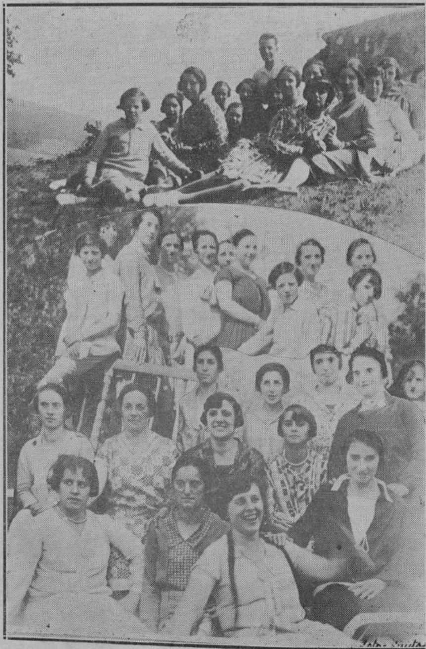
LOS PUEBLOS SE DIVIERTEN.—Grupos de lindas señoritas asistentes a las animadas fiestas de San Vicente, en Lloreda de Cayón. (Fotos SANTOS).