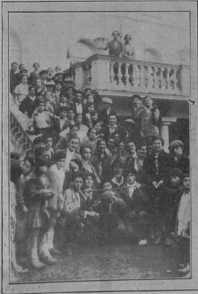
El orfeón Astillero-Guarnizo, el día de su excursión a Ontaneda, en la escalera del Hotel Balneario. (Foto HOJAS).

*** Lector: Entre todo este mundo pintoresco, "Azorín" y Muñoz Seca han reclutado el público que va a aplaudirles su diatriba contra los periodistas. Y puede que tengan razón: muchas veces, por un exceso de honradad, se sirve a quien no se debía servir. Y este es uno de los pecados del periodismo. Pero ya es hora de acabar con eso. Nosotros nos proponemos acabarlo.