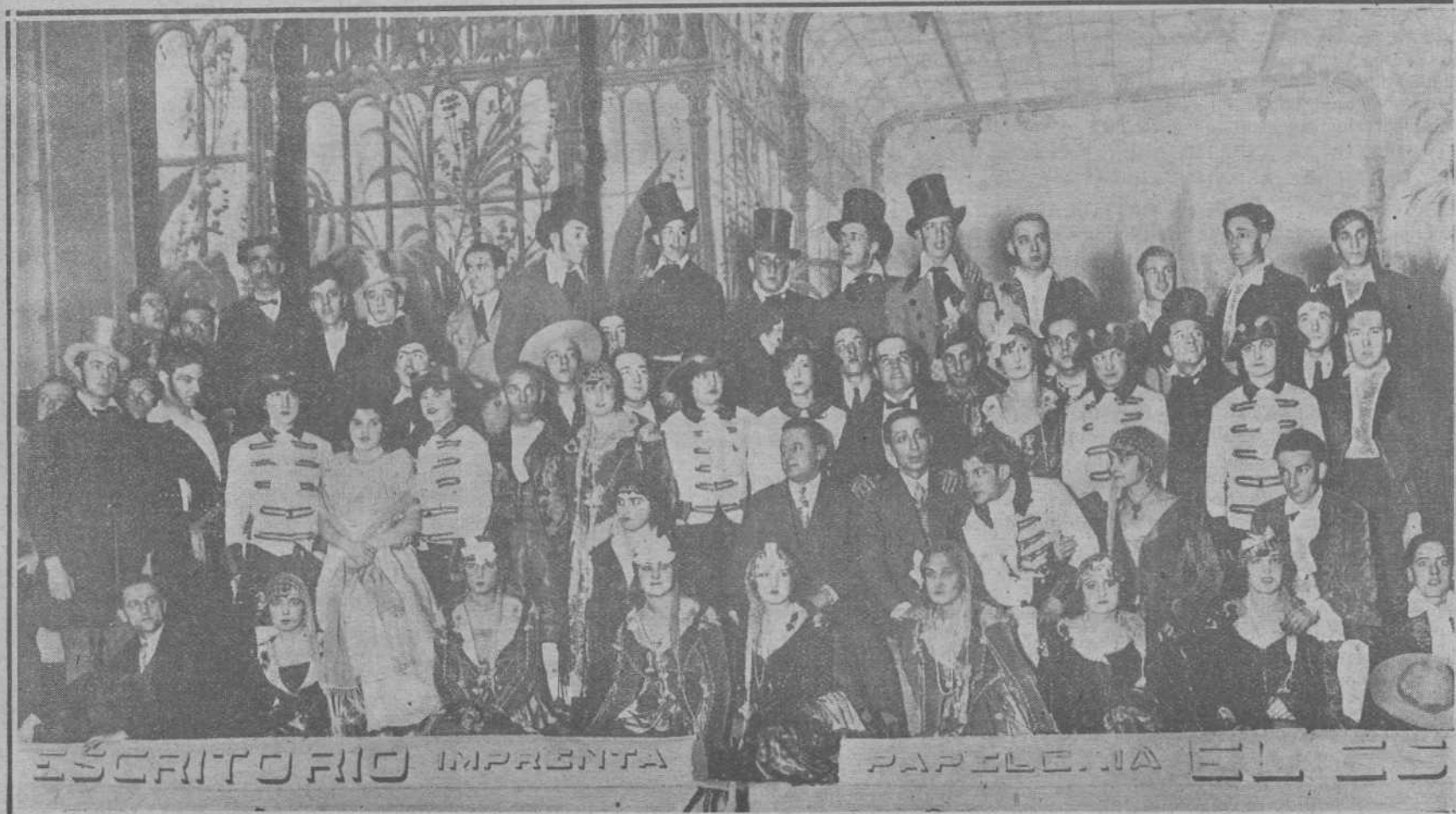
Los organizadores de la función verificada anoche en el Gran Cinema, a beneficio de la Cocina Económica, rodeados de las lindas señoritas y los distinguidos jóvenes, que interpretaron "La Calesera". (Foto ALEJANDRO).

—Los marineros yanquis de la escuadra del Pacífico produjeron una colisión en las calles de Río Janeiro con los pacíficos vecinos de la ciudad.