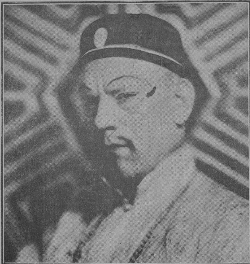
El notable actor Lon Chaney, en el principal papel de la gran producción de la M. G. M. "El honor del mandarín".

En Vallvidriera (Barcelona) se han rodado algunos metros de película para la revista de teatro "Reus, París y Londres". (Continúa en la página 19).